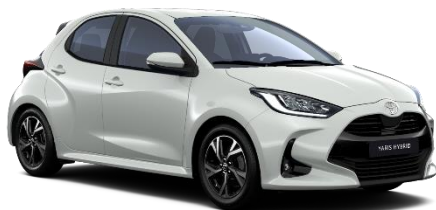
089 Platinum Pearlwhite Metallic