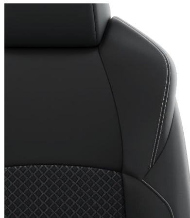
Sitzbezug Stoff mit Textillleder- Applikationen, schwarz mit Ziernähten in Grau