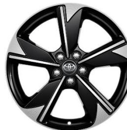
17" Leichtmetallfelge 5 Doppelspeichen schwarz