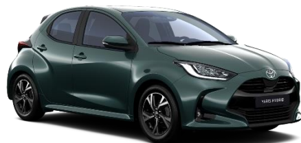
6X7 Everest Green Metallic