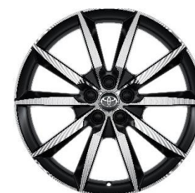
18" Leichtmetallfelge 5 Doppelspeichen schwarz/oberflächenpoliert