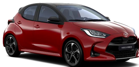
2SZ Emotional Red / Night Sky Black

Erfahrungsgemäß können Druckfarben den Farbton von Lackierungen nicht originalgetreu wiedergeben