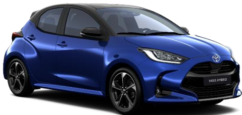
M20 Juniper Blue / Onyx Black