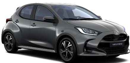
1G3 Ash Grey Metallic