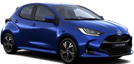
8Y8 Juniper Blue Metallic