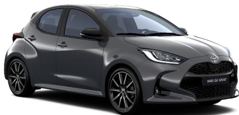
M29 Storm Grey / Onyx Black