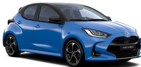
M19 Neptune Blue / Onyx Black