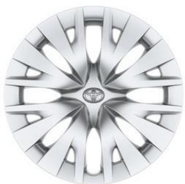
15" Stahlfelge Radzierkappe silber