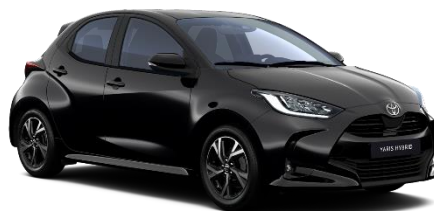
209 Night Sky Black Metallic