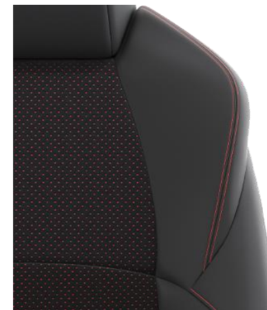
Sitzbezug Ultrasuede™/Textillleder Schwarz mit Ziernähten in Rot