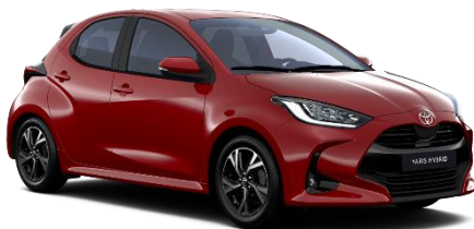
3U5 Emotional Red Metallic

Erfahrungsgemäß können Druckfarben den Farbton von Lackierungen nicht originalgetreu wiedergeben