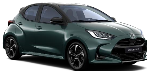
M39 Everest Green / Onyx Black