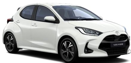
040 Pure White