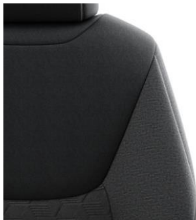
Sitzbezug Stoff, schwarz mit Ziernähten in Melange