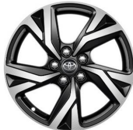
16" Leichtmetallfelge 5 Doppelspeichen schwarz/silber