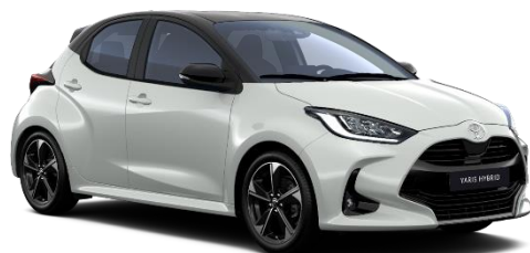
2PU Platinum Pearlwhite / Night Sky Black