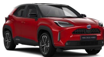
2SZ Emotional Red Metallic / Black

Erfahrungsgemäß können Druckfarben den Farbton von Lackierungen nicht originalgetreu wiedergeben. Abb. MY22