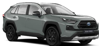
2QU Urban Khaki / Dynamic Grey