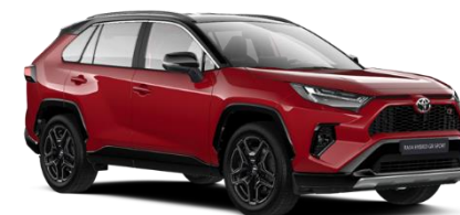
2SU Emotional Red / Black