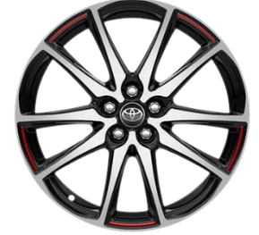
18" Leichtmetallfelge 5 Doppelspeichen schwarz/oberflächenpoliert