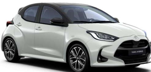
2PU Platinum Pearlwhite / Night Sky Black