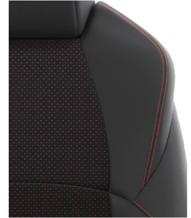
Sitzbezug Ultrasuede™/Textilleder Schwarz mit Ziernähten in Rot