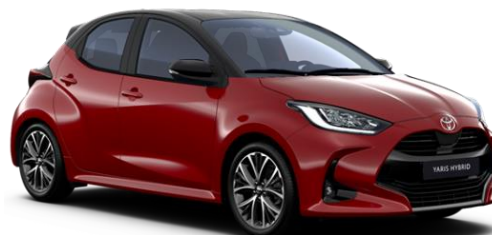
2SZ Emotional Red / Night Sky Black