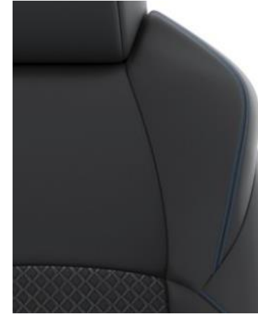
Sitzbezug Stoff mit Textilleder- Applikationen, schwarz mit Ziernähten in Blau