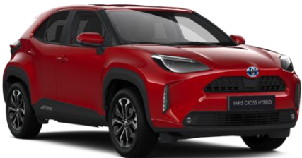
3U5 Emotional Red Metallic