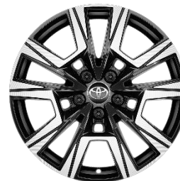
18" Leichtmetallfelge 10 Speichen Schwarz/silber