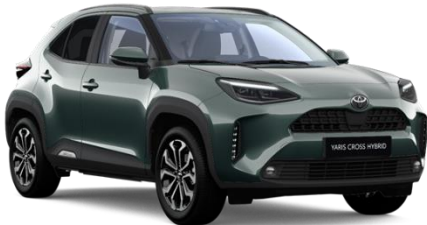
6X7 Everest Green Metallic