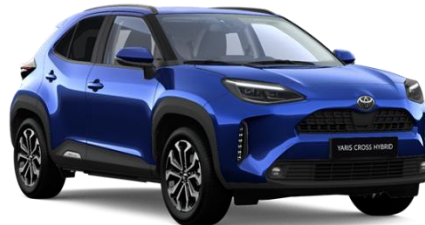
8Y8 Juniper Blue Metallic