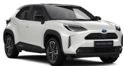
2PU Platinum Pearlwhite Metallic / Black