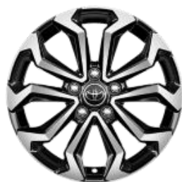
17" Leichtmetallfelge 5 Doppelspeichen schwarz/silber