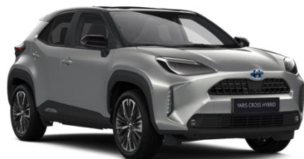
2VU Silver Metallic / Black