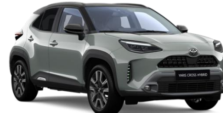
M21 Urban Khaki / Black