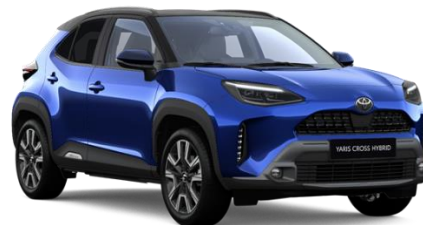
M20 Juniper Blue Metallic / Black