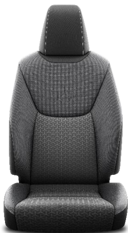
Sitzbezug Stoff schwarz