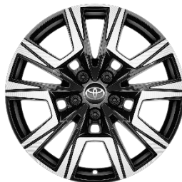
18" Leichtmetallfelge 10 Speichen Schwarz/silber