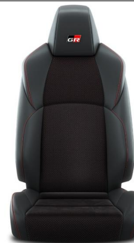
Sitzbezug Ultrasuede™ mit Textilleder-Applikationen schwarz und roten Ziernähten