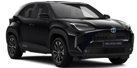
209 Night Sky Black Metallic