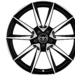
18" Leichtmetallfelge 5 Doppelspeichen schwarz/silber