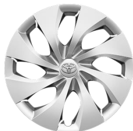
16" Stahlfelge silber