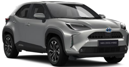
1L0 Shimmering Silver