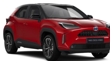
2SZ Emotional Red Metallic / Black

Erfahrungsgemäß können Druckfarben den Farbtton von Lackierungen nicht originalgetreu wiedergeben. Abb. MY22