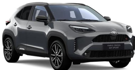
M29 Storm Grey Metallic / Black