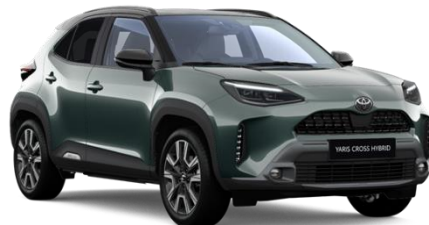
M39 Everest Green Metallic / Black