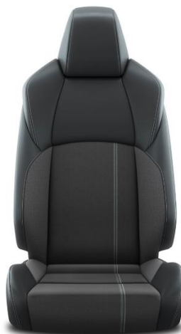
Sitzbezug Stoff mit Textilleder-Applikationen 1 taupe