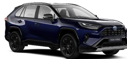
2RA Midnight Blue Metallic / Black