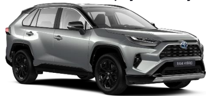
2QY Zircon Silver Metallic / Black