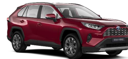
3T3 Tokyo Red Metallic