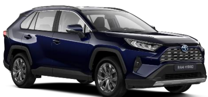
8X8 Midnight Blue Metallic