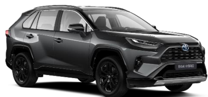
2QZ Ash Grey Metallic / Black