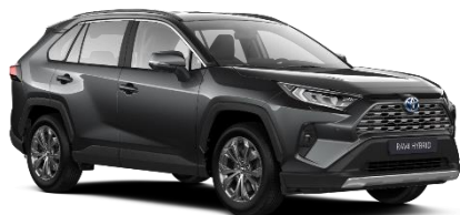
1G3 Ash Grey Metallic