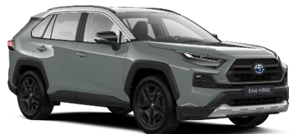
2QU Urban Khaki / Dynamic Grey