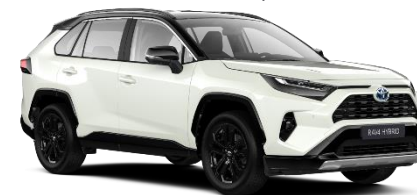
2PS Platinum Pearlwhite Metallic / Black

Erfahrungsgemäß können Druckfarben den Farbton von Lackierungen nicht originalgetreu wiedergeben