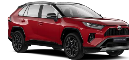
2SU Emotional Red / Black