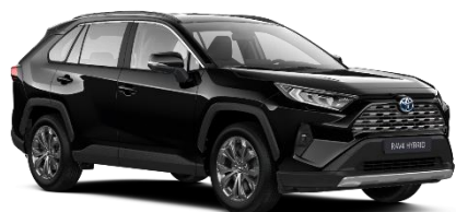
218 Attitude Black Metallic