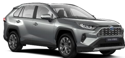
1D6 Zircon Silver Metallic