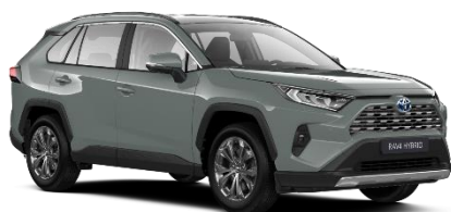
6X3 Urban Khaki