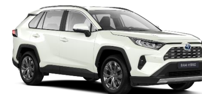
089 Platinum Pearlwhite Metallic