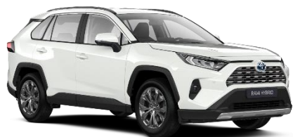
040 Pure White