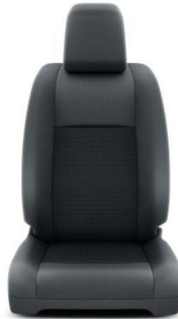
Sitzbezug Stoff Dunkelgrau

KASTENWAGEN / DOPPELKABINE / FAHRGESTELL