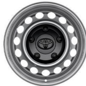
16" Stahlfelgen inkl. Radnabenabdeckung

KASTENWAGEN / DOPPELKABINE / FAHRGESTELL