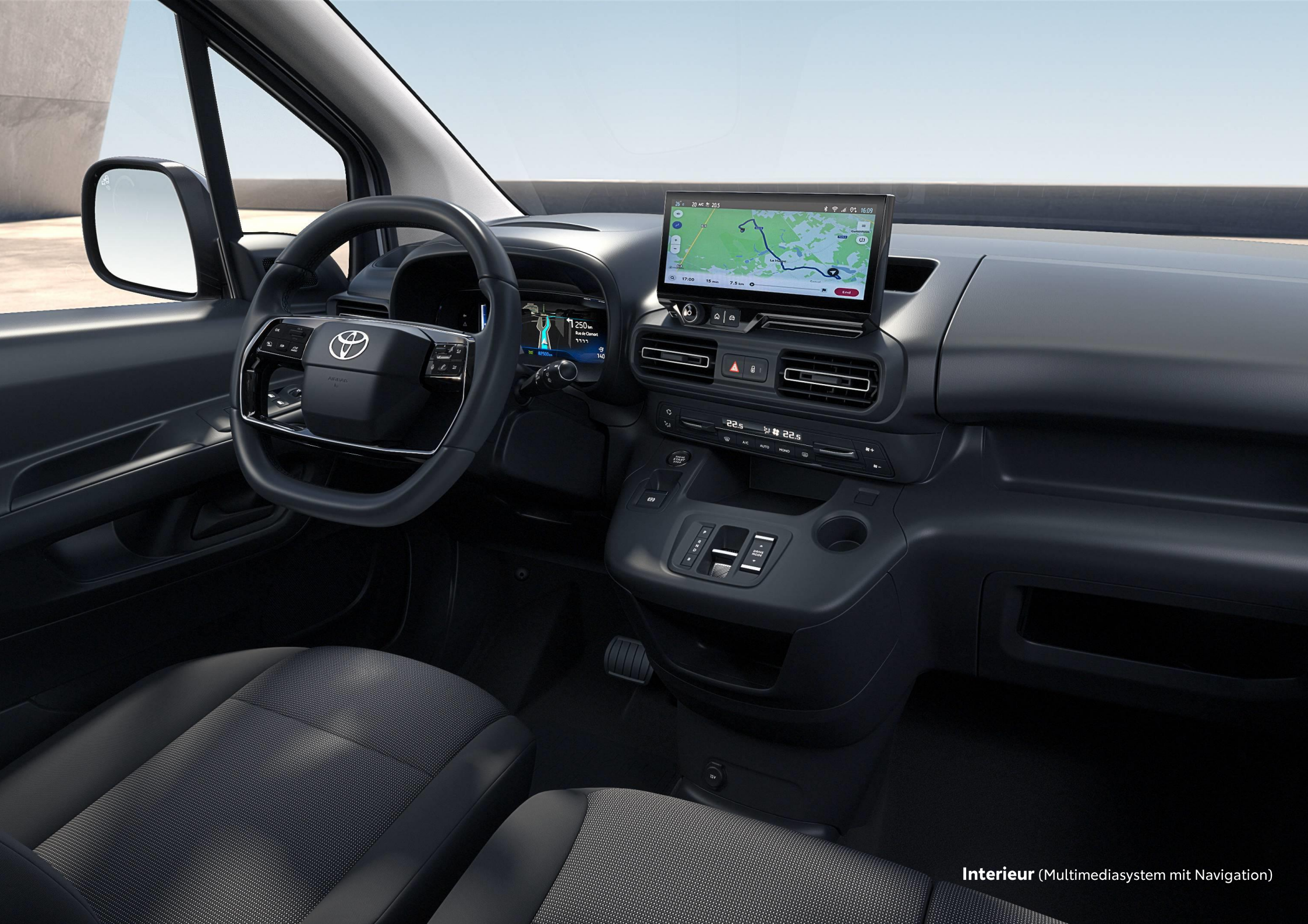
Interieur (Multimediasystem mit Navigation)