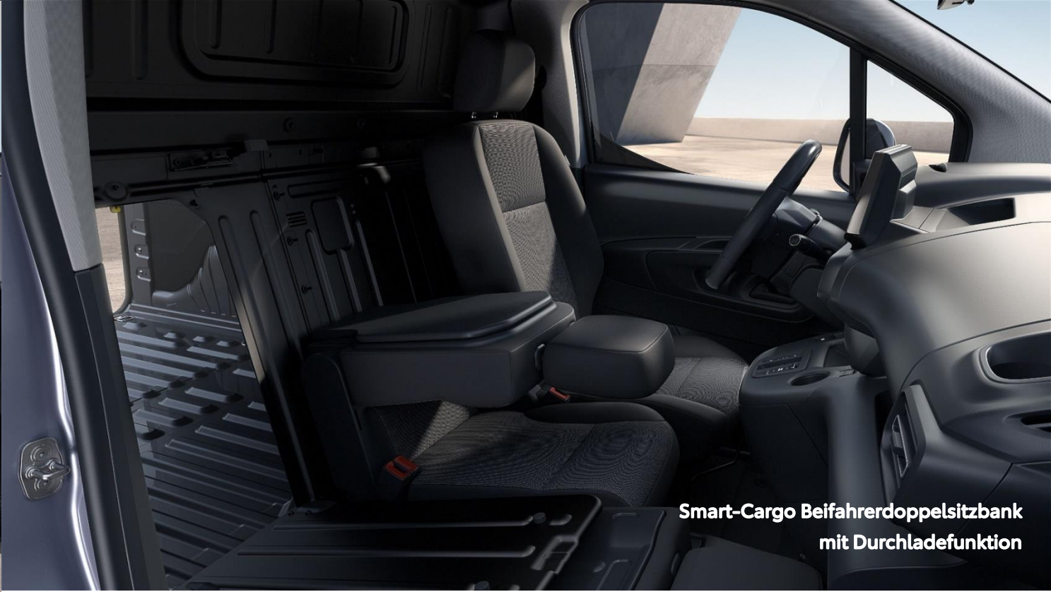
Smart-Cargo Beifahrerdoppelsitzbank mit Durchladefunktion