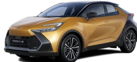
2YT – Sulfur Gold / Onyx Black

Erfahrungsgemäß können Druckfarben den Farbton von Lackierungen nicht originalgetreu wiedergeben.