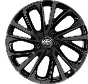
19" Leichtmetallfelge 5 Doppelspeichen schwarz