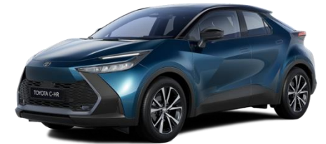
785/2YB – Midnight Teal / Onyx Black