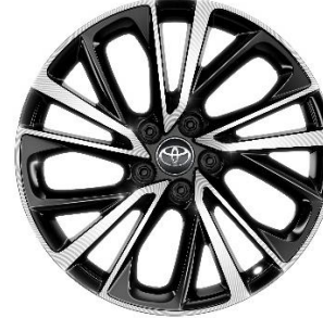
19" Leichtmetallfelge 5 Doppelspeichen schwarz/oberflächenpoliert