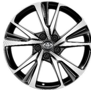
18" Leichtmetallfelge 5 Doppelspeichen schwarz/oberflächenpoliert