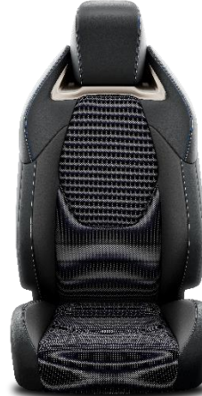
Sitzbezug Stoff mit veganem Leder und Ultrasuede™ Applikationen