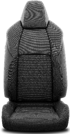
Sitzbezug Stoff schwarz