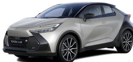
2MR – Sonic Silver / OnyxBlack