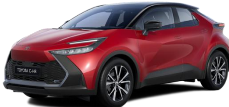
2TB – Emotional Red / Onyx Black