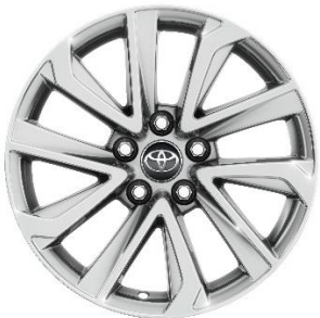
17" Leichtmetallfelge 5 Doppelspeichen silber