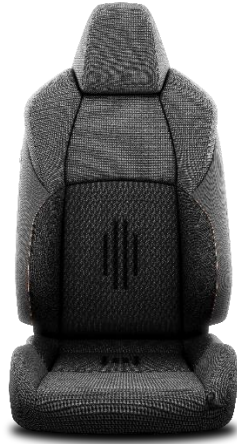
Sitzbezug Stoff schwarz