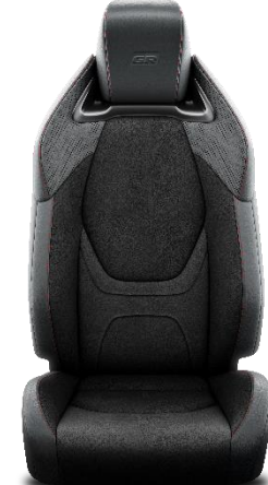
Sitzbezug Ultrasuede™/veganes Leder Mit roten Ziernähten