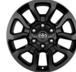
18" Leichtmetallfelge 5 Doppelspeichen schwarz