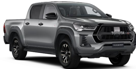
1D6 Zircon Silver Metallic