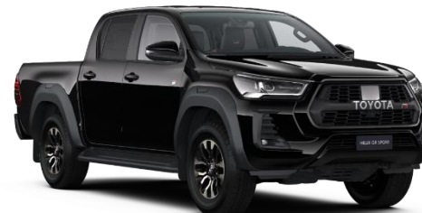
218 Attitude Black Metallic