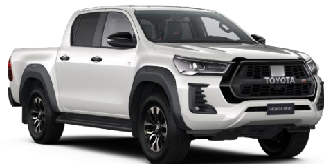
089 Platinum Pearlwhite Metallic

Erfahrungsgemäß können Druckfarben den Farbton von Lackierungen nicht originalgetreu wiedergeben