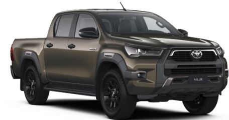
6X1 Oxide Bronze Metallic