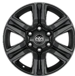
17" Leichtmetallfelge 5 Speichen schwarz