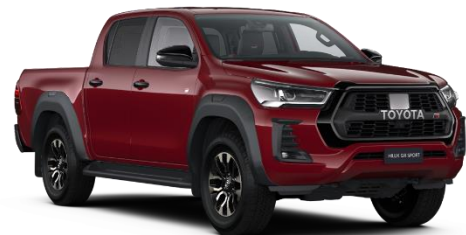
3T6 Crimson Spark Red Metallic