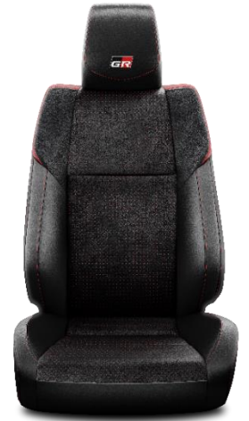
Sitzbezug Suede® perforiert 2) mit Leder-Applikation und roten Highlights schwarz