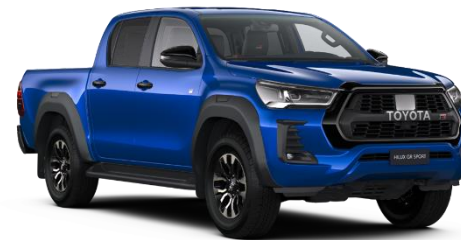
8X2 Nebula Blue Metallic