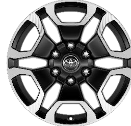
18" Leichtmetallfelge 6 Speichen, Y-Design schwarz/oberflächenpoliert