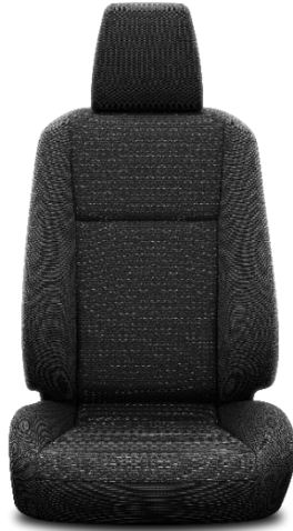
Sitzbezug Stoff schwarz