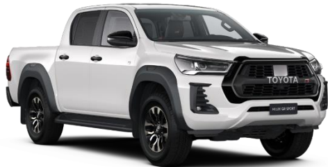
040 Pure White