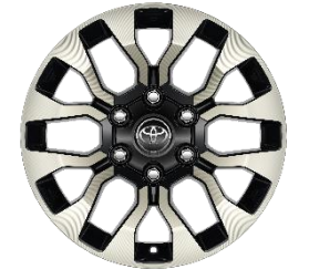
17" Leichtmetallfelgen 6 Doppelspeichen schwarz/oberflächenpoliert