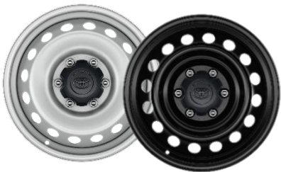
17" Stahlfelge mit Nabenkappe silber (Single Cab) schwarz (X-tra & Double Cab)