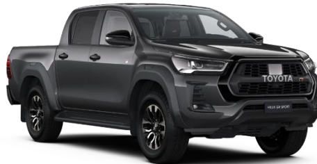
1G3 Ash Grey Metallic