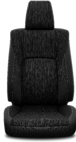
Sitzbezug Stoff schwarz