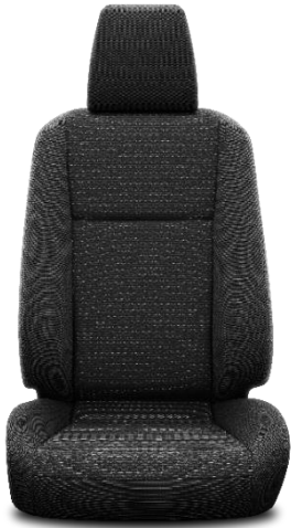
Sitzbezug Stoff schwarz