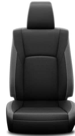
Sitzbezug Leder perforiert 1) Schwarz/grau