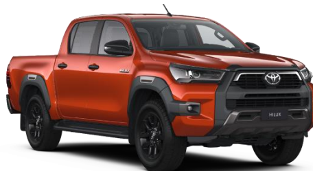
4R8 Inferno Orange Metallic