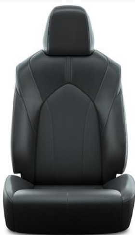
Leder 1 , schwarz, perforiert (LB20)