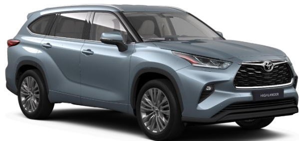
1K5 Moondust Metallic