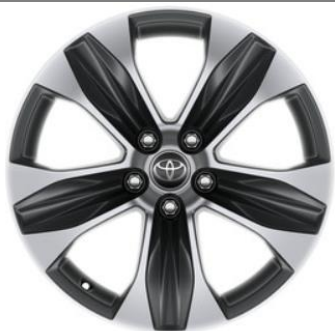
18" Leichtmetallfelge 5 Speichen Anthrazit / oberflächenpoliert