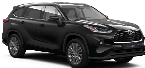
218 Attitude Black Metallic