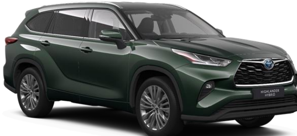
6X5 Cypress Green Metallic