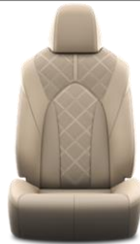
Premium-Leder 1 , beige, perforiert (LA40)