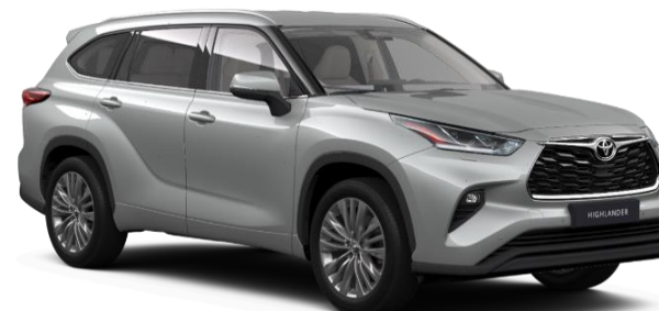
1J9 Celestial Silver Metallic