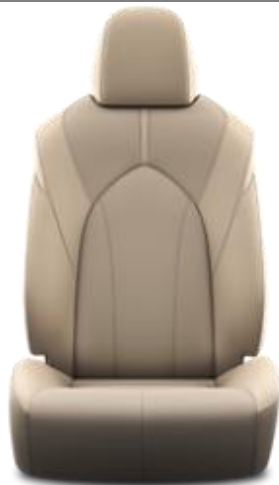
Leder 1 , beige, perforiert (LB40)