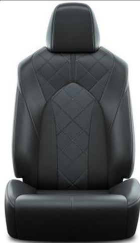
Premium-Leder 1 , schwarz, perforiert (LA20)