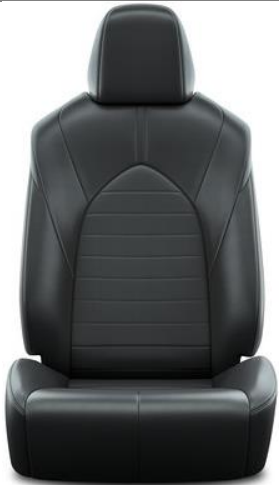
Textilleder, schwarz (EB20)