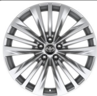
20" Leichtmetallfelge 5 Trippelspeichen silber