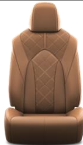
Premium-Leder 1 , cognac, perforiert (LA41)