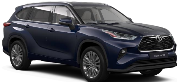
8X8 Midnight Blue Metallic