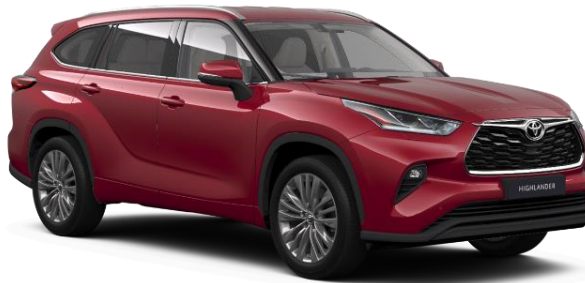
3T3 Tokyo Red Metallic