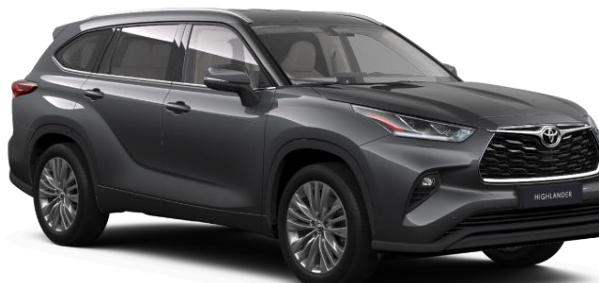
1G3 Ash Grey Metallic