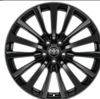
20" Leichtmetallfelge 15 Speichen schwarz