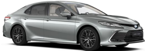
1F7 Ultra Silver Metallic