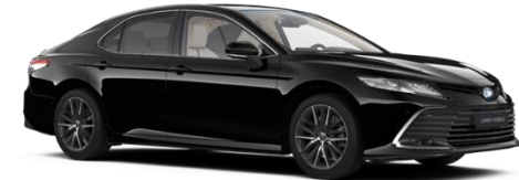
218 Attitude Black Metallic