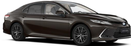
4X7 Graphite Brown Metallic