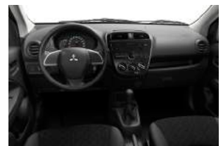
INTRO, INFORM Stoffsitze schwarz