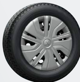
14" Stahlfelgen ▲ Stahlfelge mit Spezial-Zierkappe Intro, Inform