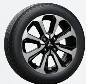
15" Alufelgen ▲ Diamanten-cut in silber/schwarz Invite, Diamond