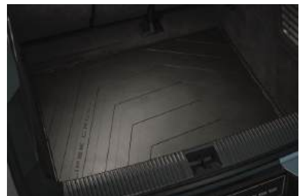
▲ Kofferraumwanne Wasserdicht, pflegeleicht, passgenau.