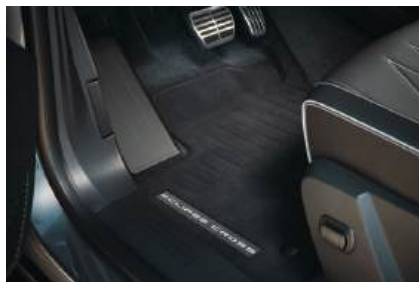
▲ Textilmattensatz, 4-teilig Hochwertiger Velours.