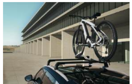
▲ Ski-/Snowboardträger Für max. 4 Paar Ski oder 2 Snowboards.