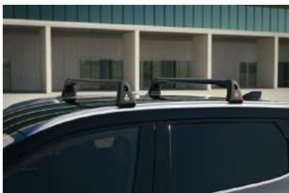
▲ Dachträger Basis für Dachboxen, Fahrradträger, Skihalter.