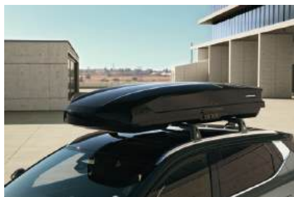
▲ Dachbox 380, 480 oder 630 Liter.