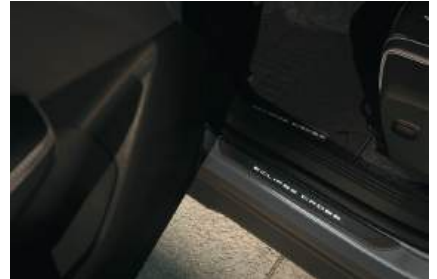
▲ Einstiegsleisten mit LED-Beleuchtung Mit moderner LED-Technik und Eclipse Cross Logo.