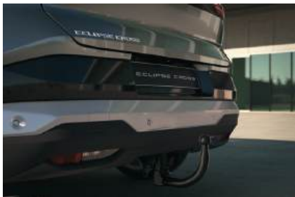
▲ Anhängerkupplung abnehmbar Hochfester Stahl, korrosionsschutz.