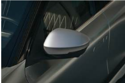
▲ Spiegelkappen Metallgrau, 2 Stück.