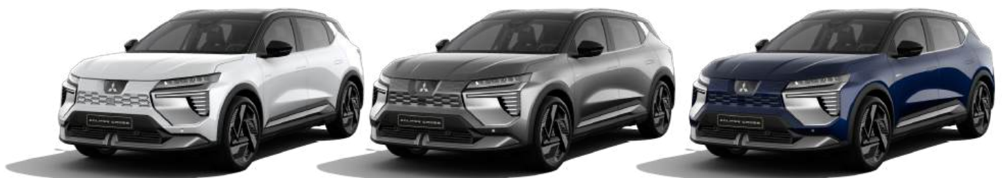
Crystal Weiß ▲

Ob dezent oder auffällig: Der Eclipse Cross steht in fünf modernen Metallic-Lackierungen zur Wahl. Ab der Ausstattungsvariante Intense auch mit dynamischer Zweifarb-Lackierung mit schwarzem Dach erhältlich.