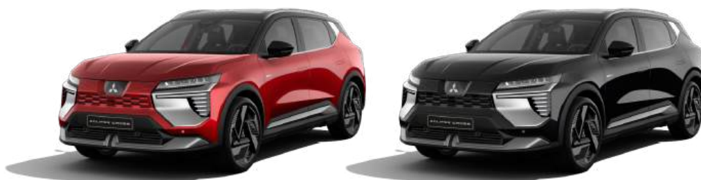
Sunrise Rot ▲