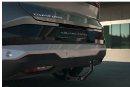
▲ Anhängerkupplung starr Perfekt für Anhänger, Wohnwagen oder Fahrradträger.