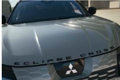
▲ Eclipse Cross-Schriftzug für die Motorhaube UV-beständig, kratzfest, langlebig.