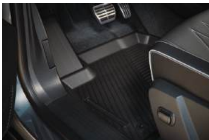
▲ Gummimattensatz, 4-teilig Ganzjährig, Allwetter geeignet.