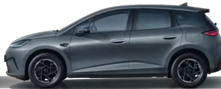
Time Grey (Variante Boost, 16" Aluminiumfelgen)