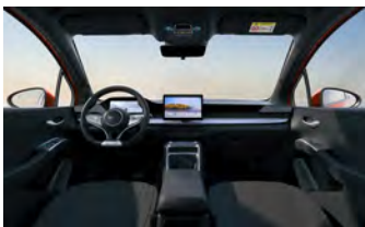
Black (Variante Active)