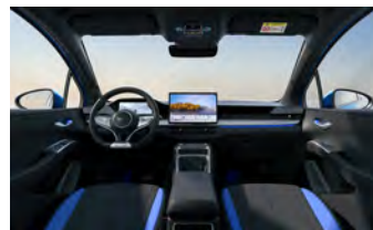
Black & Blue (Variante Sport)