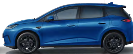
Ocean Blue (Variante Sport, 18" Aluminiumfelgen schwarz)