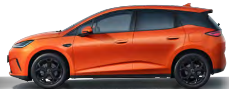
Orange Sunset (Variante Sport, 18" Aluminiumfelgen schwarz)