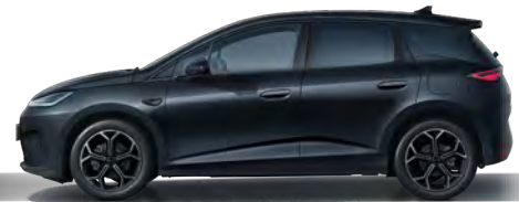
Obsidian Black (Variante Comfort, 18" Aluminiumfelgen)