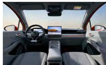
Ocean Grey (Variante Comfort)