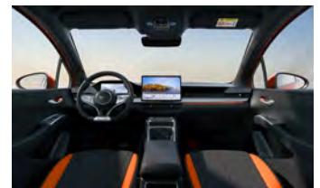
Black & Orange (Variante Sport)