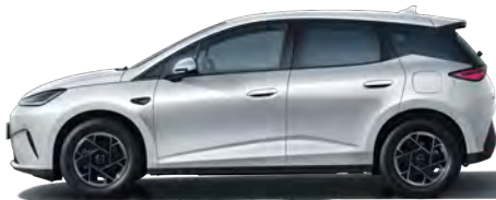
Skiing White (Variante Active, 16" Aluminiumfelgen)