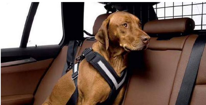
Sicherheitsgurt für Hunde

Fündig geworden? Mehr finden Sie Online oder bei Ihrem BYD- Händler!