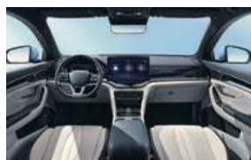
Blue and grey