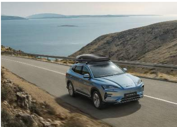
Dachträger und Dachbox