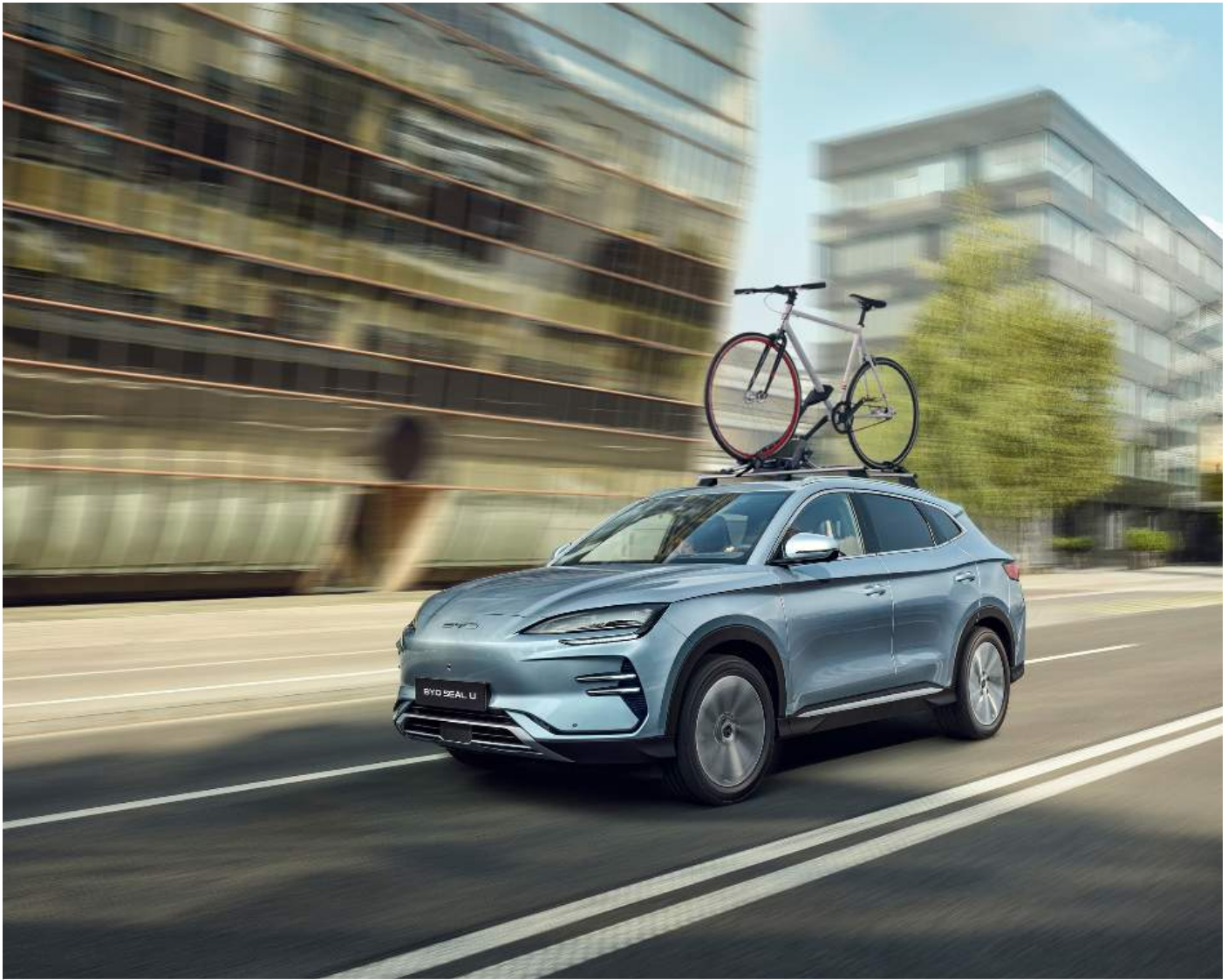
Dachträger und Fahrradträgeraufsatz