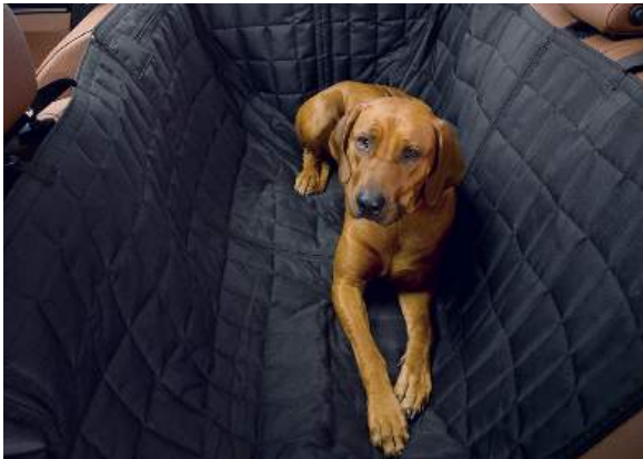
Schondecke für die Rückbank