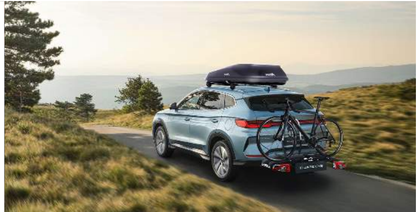
Dachträger, Dachbox und Heckfahrradträger