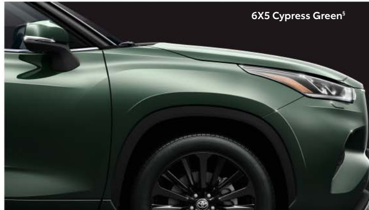
6X5 Cypress Green s