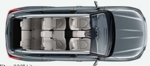
7 Sitze 322 § Liter

Wohin Sie auch reisen, was immer Sie dabei haben möchten: Der Highlander bietet die passende Sitzkonfiguration.