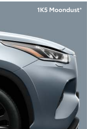
1K5 Moondust *