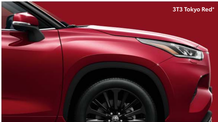
3T3 Tokyo Red *