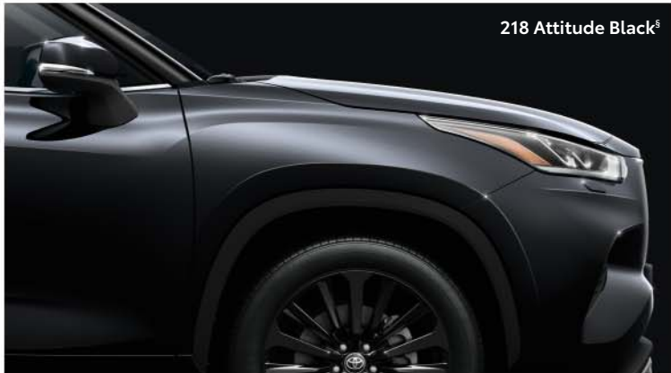
218 Attitude Black s