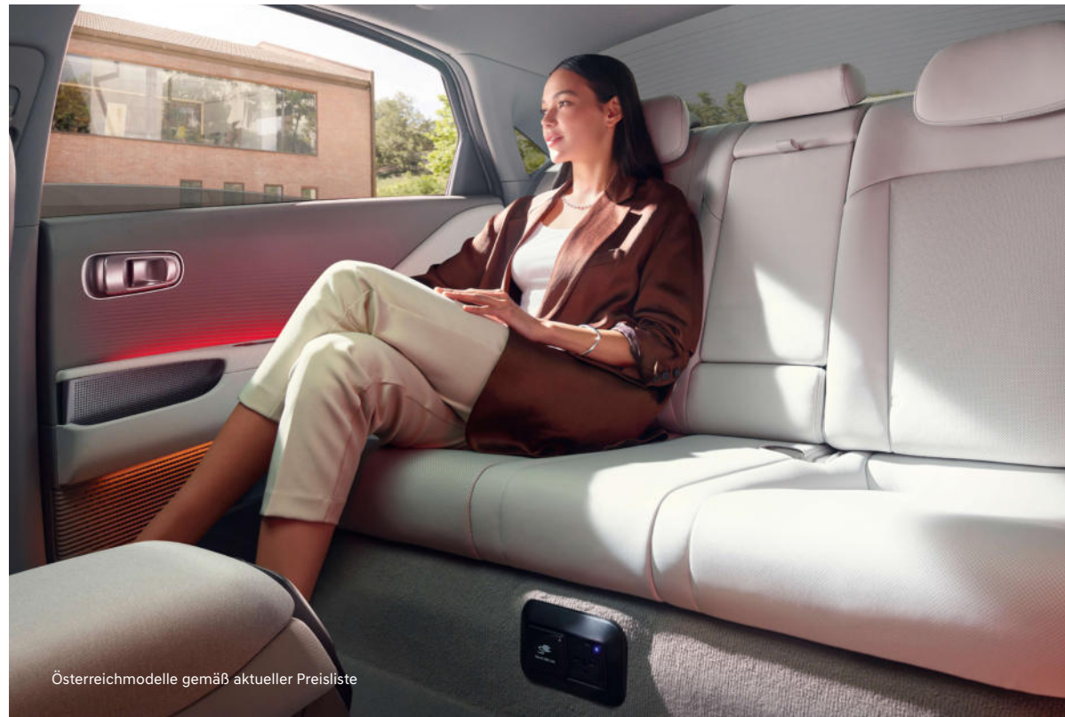
Österreichmodelle gemäß aktueller Preisliste