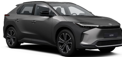
1L5 Precious Metal Metallic