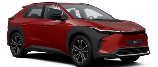
3U5 Emotional Red Metallic