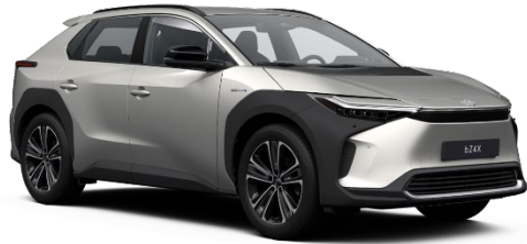
1J6 Sonic Silver Metallic