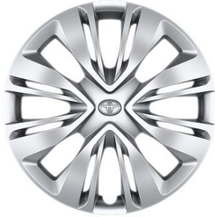
17" Stahlfelge Radzierkappe Silber