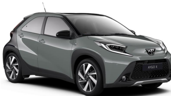
2VN Tarragon (Premium Pastel) / Night Sky Black

Erfahrungsgemäß können Druckfarben den Farbton von Lackierungen nicht originalgetreu wiedergeben