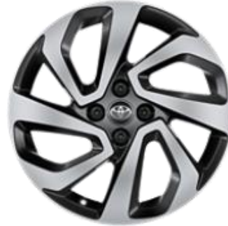
18" Leichtmetallfelge 4 Doppelspeichen, schwarz/oberflächenpoliert