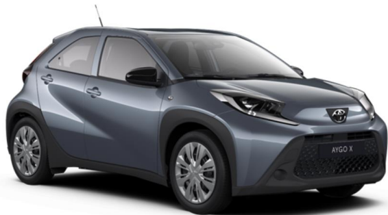
1K3 Persian Salt Metallic