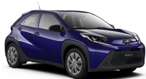
8Y8 Juniper Blue Metallic

Erfahrungsgemäß können Druckfarben den Farbton von Lackierungen nicht originalgetreu wiedergeben