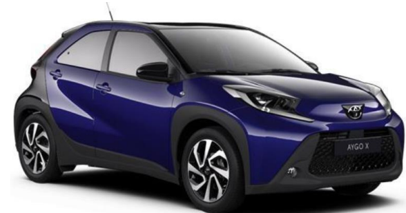
2VL Juniper Blue Metallic / Night Sky Black