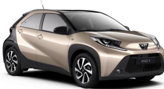
2VJ Ginger Beige Metallic / Night Sky Black