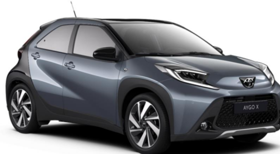
2UP Persian Salt Metallic / Night Sky Black